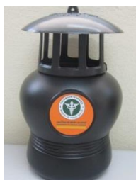
ด้านหน้า