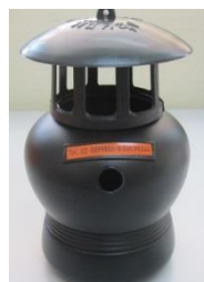
ด้านหลัง